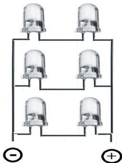
Figura 1 - Painel fotovoltaico criado a partir de led's.